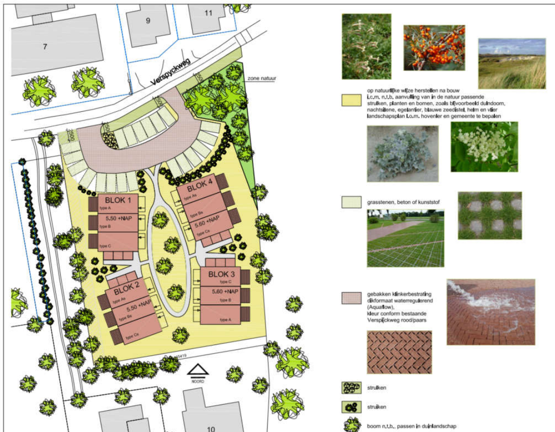
Figuur 4.1: Situatietekening