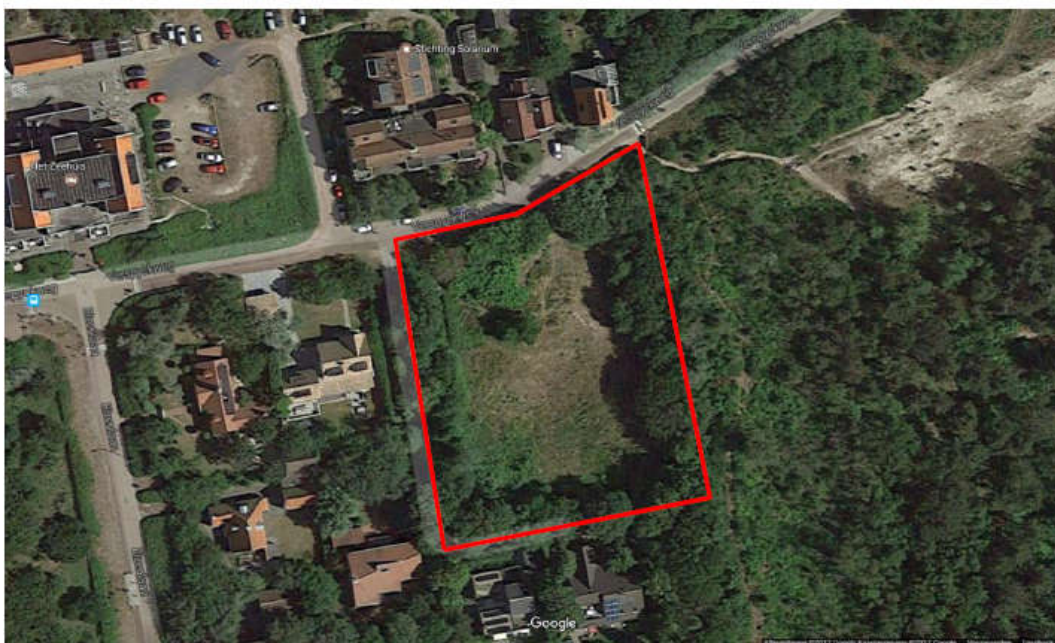
Figuur 1.1: Ligging plangebied

Het plangebied is gelegen aan de noordrand van Bergen aan Zee op de overgang tussen het duinlandschap en de bosrand. Het plangebied is direct vanaf de Verspijkweg ontsloten. Aan de oostzijde wordt het perceel begrensd door het bos, aan de westzijde grenst het aan de oprit van ten zuiden van het terrein gelegen villa's. In figuur 1.1 is de ligging weergegeven.